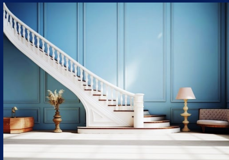
Коридори і кухні

Фарба Kolorit Ultimate особливо рекомендується для використання в приміщеннях з високим експлуатаційним навантаженням, що зазнають забруднення та зносу: